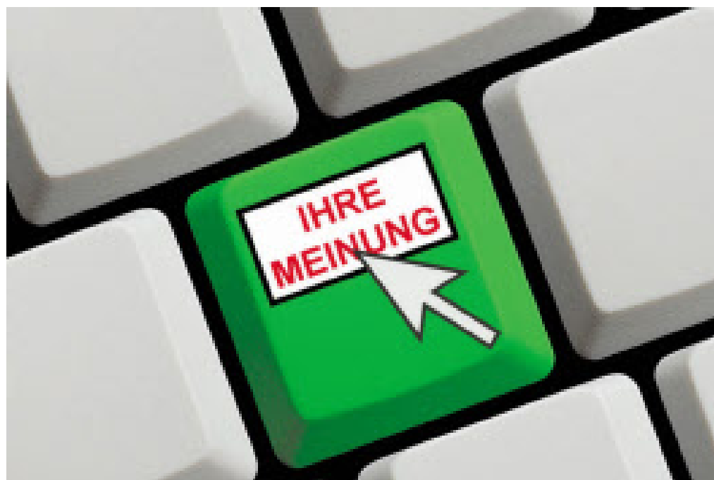
Immer öfter erfolgt das Feedback über eine Firma via Internetportal.

Unternehmen, die bereits Digital Employer Branding betreiben, sind zwar zukunftsorientiert, aber noch in der Minderheit: Eine aktuelle Erhebung der deutschen Employer-Branding-Beratung Wertekern hat belegt, dass aktuell erst zehn Prozent der in einer Stichprobe untersuchten Arbeitgeber kununu aktiv nutzen.